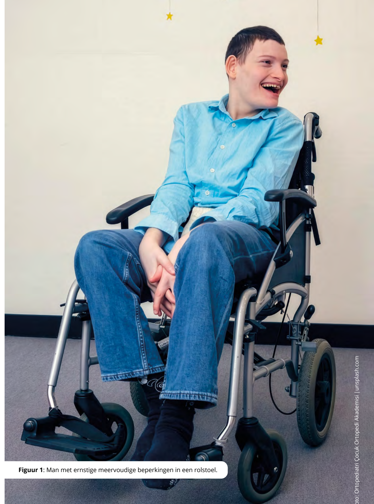
Figuur 1: Man met ernstige meervoudige beperkingen in een rolstoel.