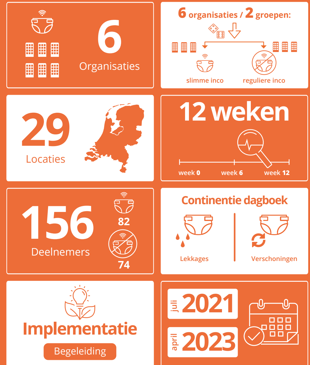
Figuur 2: Onderzoeksopzet voor het meten van de effectiviteit van slimme continenzorg