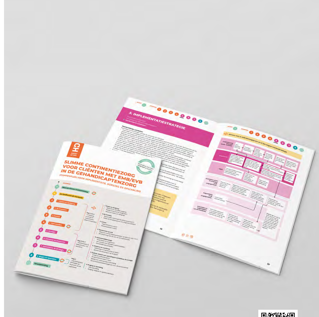
Figuur 3: Wij maakten ook een Nederlandstalig stappenplan voor projectleiders innovatie in de gehandicaptenzorg. Scan de QR-code of download via www.academyhetdorp.nl

Volledige artikel: https://doi.org/10.1111/jppi.70007